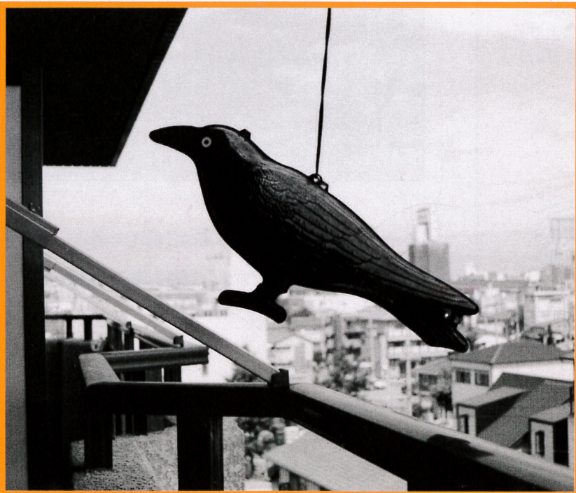
ハトおどしのつり下げ例